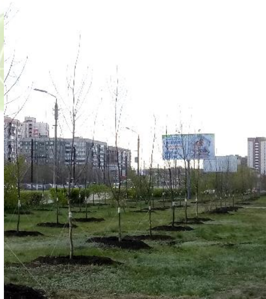
ул. Советская, 166-168