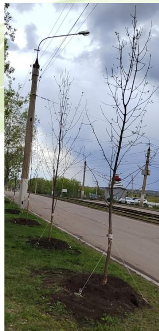
ул. Вокзальная, 106-118