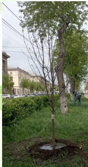
пр. Ленина, 15-27