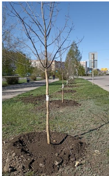
ул. Труда, 14-20