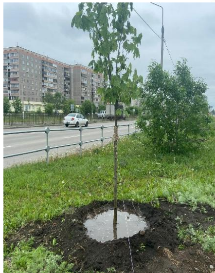
ул. 50-летия Магнитки, 31-47