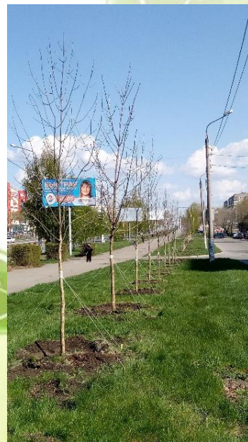
пр. К. Маркса, 155-159